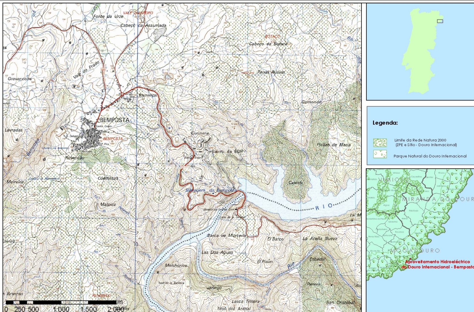
Figura 1 - Localização Geográfica do Projecto