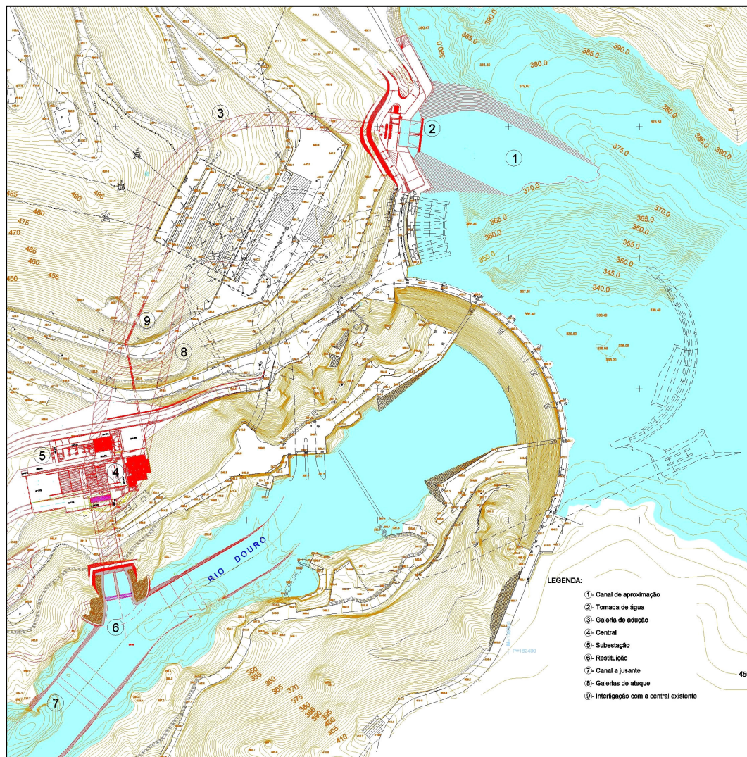
Figura 3 - Localização dos principais elementos do Reforço de Potência do Aproveitamento Hidroelétrico do Douro Internacional - Bemposta (a vermelho)

O circuito hidráulico (ver Figura 3 ) que integra as obras de reforço do potência é constituído, de montante para jusante, por: