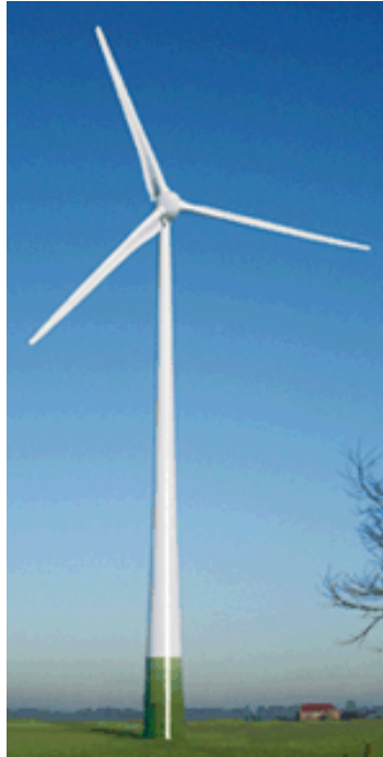
FIG. 2 – Perspetiva de um Aerogerador

A montagem das torres, com recurso a grua, é uma tarefa que se desenvolve normalmente durante um ou dois dias. A grua eleva e posiciona troço a troço, até à altura de 95 m no Parque Eólico de Corte dos Álamos e de 85 m no Sobre-equipamento do Parque Eólico de Guerreiros.